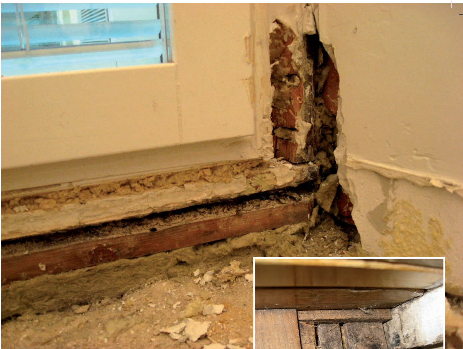
Ikkunat on uusittu, mutta vanhan ikkunan pilaantuneet puosat ja eristeet on jätetty poistamatta homepommiksi.

mitään. Toki itiöt voivat kuljettaa homeiden haitallisia kemikaaleja mukanaan, mutta eivät välttämättä aina. Suuri osa ärsytyksestä saadaan juuri kaasumaisessa muodossa. Kosteusvaurioista löytyy erilaisia mikrobeja; homeita, hiivoja ja bakteereja. Kasvaessaan ne tuottavat suuren määrän erilaisia aineenvaihduntatuotteita, kemikaaleja. Osa niistä haiskahtaa homeelle, kun taas jokin hyvinkin haitallinen home voi olla täysin hajuton. Osa homeiden tuottamista kemikaaleista on haitattomia, osa homeista voi olla sellaisia, joita esim. elintarviketeollisuuskäytössä hyödyntää. Osa homeista voi olla allergisoivia ja osa myrkyllisiä. Näiden kahden jälkimmäisen kohdalla voidaan puhua kemikaalialtistuksesta. Se voi ilmetä erilaisina oireiluna ja sairasteluna, kuten mm. toistuvina poskiontelon- ja keuhkoputkentulehduksina.