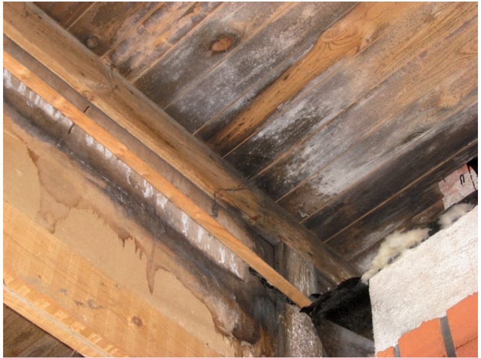
Rivitalossa tasakaton tuuletus ei ole toiminut. Katon ilmanvaihdon puute on johtanut massiivisten mikrobikasvustojen kehittymiseen.