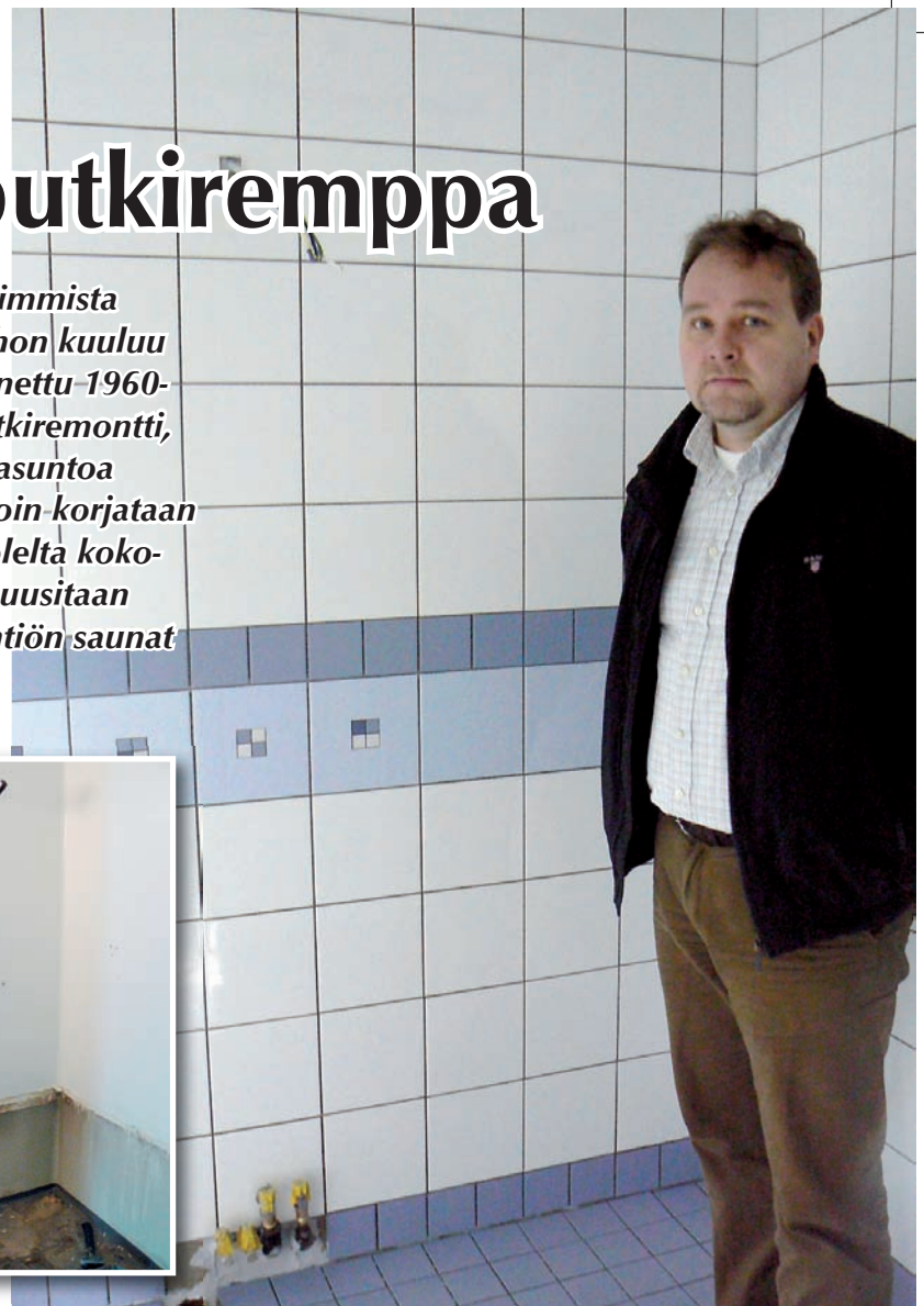
Kylpyhuone ennen remonttia... ja kylpyhuone remontin jälkeen.

aiheuttavan vähiten haittaa asumiselle, koska rakenteita ei tarvitse avata.