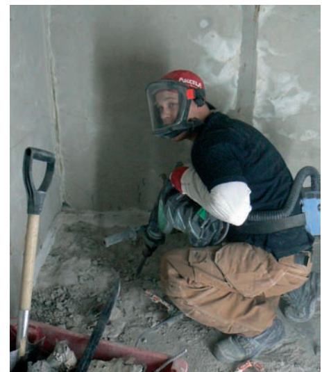
Työtilat on alipaineistettu, jottei asuntoihin kulkeudu pölyä. Likainen ilma puhalletaan ikkunan kautta ulos.

Asukkaiden ja tekijöidenkin kannalta urakan haasteellisin osuus on kylpyhuoneen uusiminen. Asunnon keskimääräinen työaika on n. 6 viikkoa. WC- ja suihkutila on poissa käytöstä 4-5 viikkoa, jolloin käytetään saunatiloihin tehtyjä lisä-wc:eitä. Asukkaat voivat valita viidestä arkkitehdin suunnittelemasta laattavaihtoehdosta kylpyhuoneen laatoituksen, tai suunnitella ja hankkia itse laatat, jotka asennetaan urakkaan kuuluvana. Keittiön käyttöveden katkos on n. 5 vrk. Työ etenee portaittain, kunnes urakka on kokonaisuudessaan valmis.